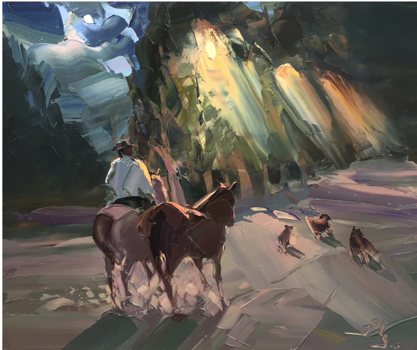
“Dos Luces” San Martín de los Andes. Oleo. 50 x 60. 2010