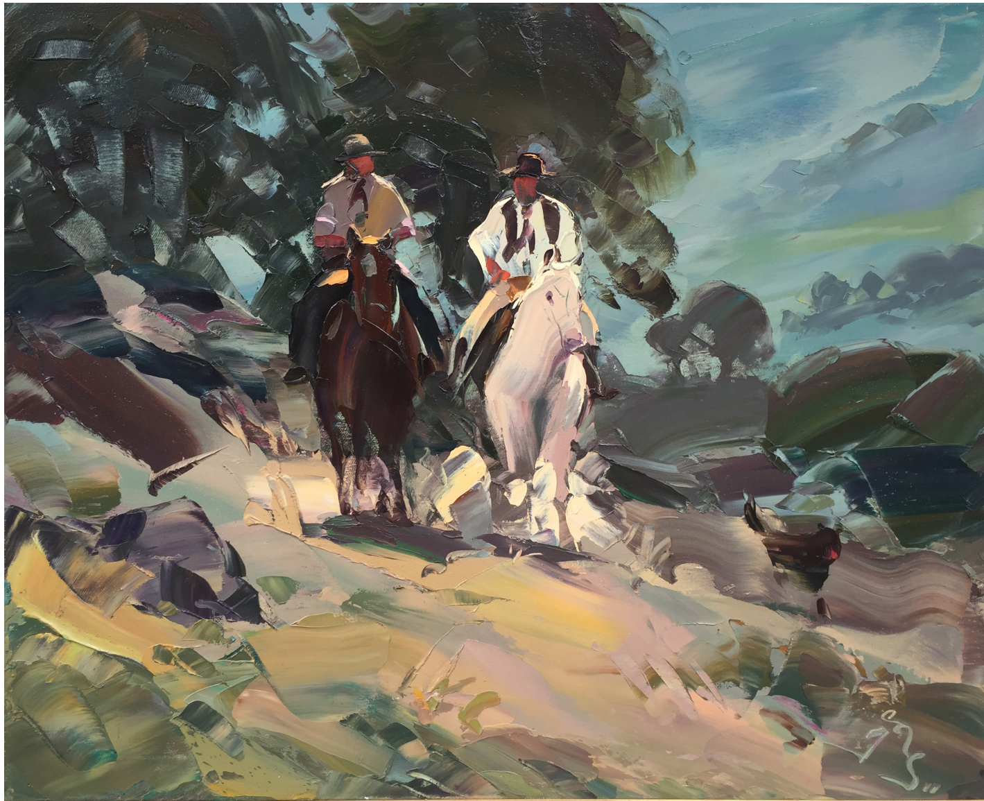
“Patrones y Pehuenes” Valle de la Magdalena, Neuquén. Oleo. 65 x 81. 2011