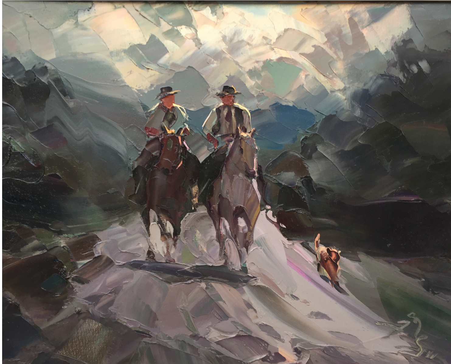
“Nohecitas Claras” San Martín de los Andes. Oleo. 40 x 50. 2011