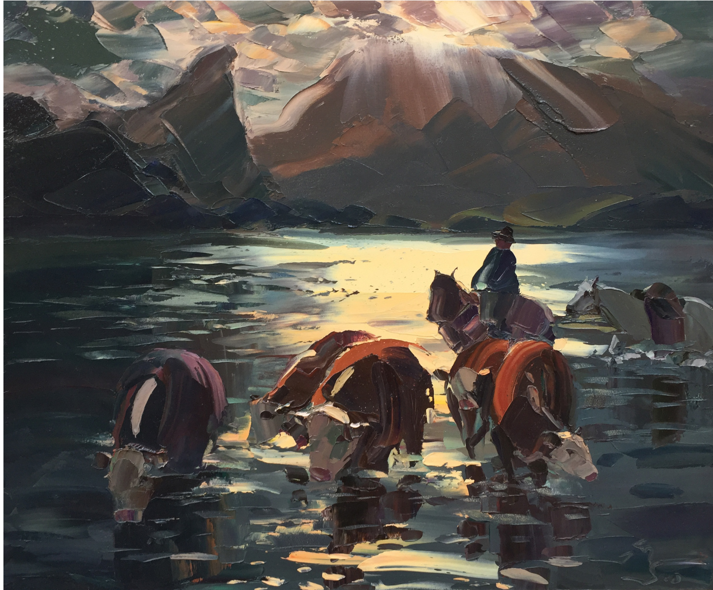
“Rinconada Hereford” La Rinconada, Neuquén. Oleo. 60 x 74. 2010