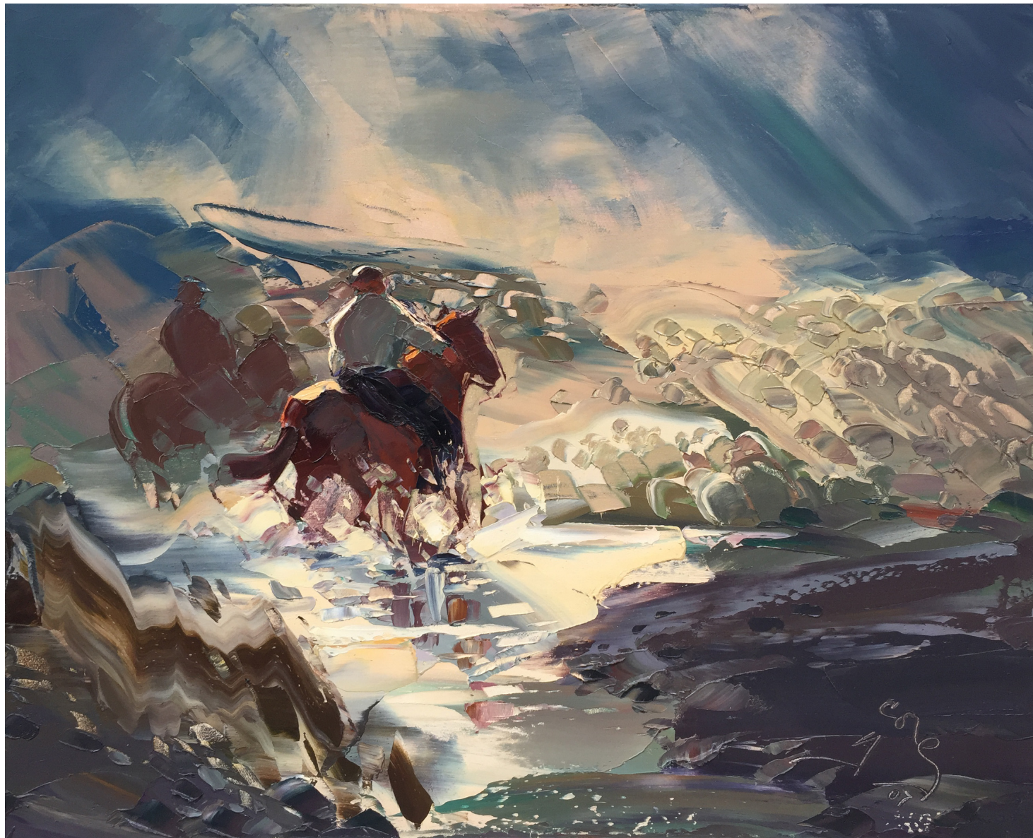
“Paso Roballos” Santa Cruz. Oleo. 65 x 81. 2007